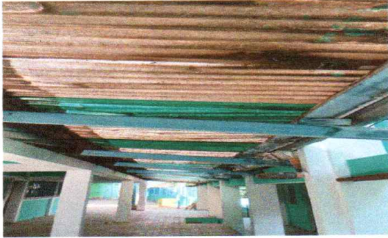
Foto 7: Sustitución de lamina donde unen ambos corredores del edificio escolar