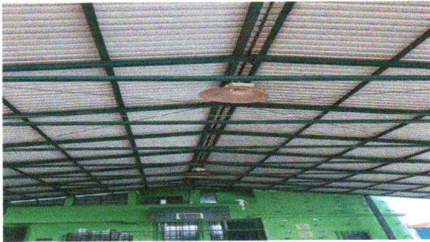
Foto 9: Sustitución de lámparas de la cancha polideportiva del edificio escolar